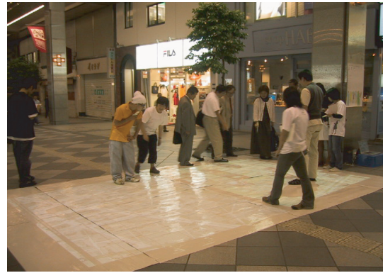
図 3 仙台における事例

展示会場は仙台市中心部のサンモール一番商店街、藤崎百貨店の前で開閉式のアーケードがかかった歩行者専用道路となっている商店街の路上である。人通りの多い路面の中央に敷かれた 5.4m × 3.6m のスクリーンに、アーケードの柱の地上高さ 4m のところに設置した 2 機の液晶プロジェクタから映像を投影した（図 3）。この