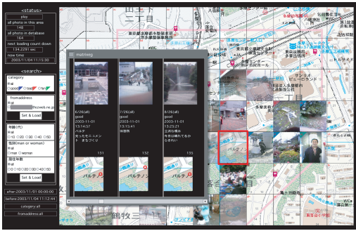
図 8 時空間ポエマー Ver.1.2

時に、登録されている全画像および個々の画像の詳細情報（日付け、投稿日時、タイトル、本文）が別ウィンドウに表示される（図 8）。同時に最大 3 つの情報が表示され、3 つ以上の画像が登録されている場合はスクロールバーを操作することにより切り換えることができる。