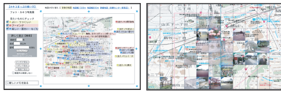
図 6 運用実験の形態

しながら課題を見つけていくことができるのではないかと考え、東京都多摩市において、多摩市役所くらしと文化部多摩センター活性化推進室の協力を得て二度の運用実験を行った(図5)。写真の収集は、京王多摩センター駅を中心に東西約1.5km×南北約1kmを範囲とし、全体を11×7のセルに区画した。