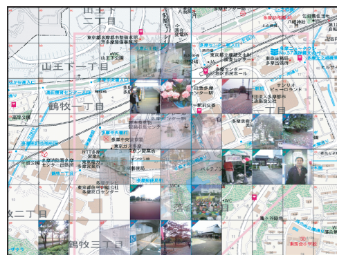
図 2 表示クライアント

用いたアプリケーションによってメールを受信する。受信したメールから、送信者のアドレス、送信者名、タイトル、本文、画像、位置情報、送信日時といった情報を取得し、データベースに登録する。