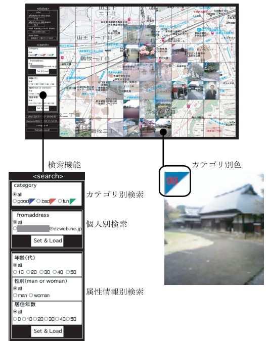
図 7 時空間ポエマー Ver.1.1