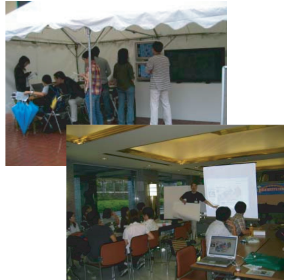
図5 アフターワークショップ・街頭展示

リアクションをみると、中高年層は、GPSによる位置情報の取得やインターネットを利用して映像をリアルタイムに更新している点など、システムを支えるテクノロジーそのものに感心する傾向が多いのに対し、10代以下の若い世代は、携帯電話の写真を互いに見せあい、共